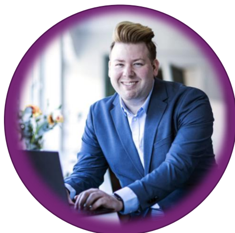
Verksamhet och Applikationskonsult @CRMK