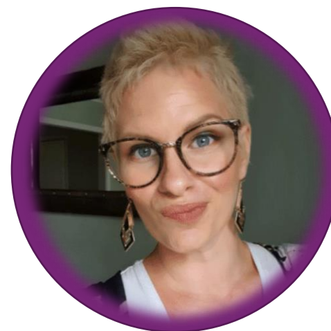
Verksamhet och Applikationsarkitekt @CRMK